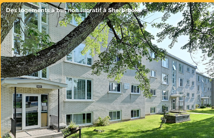
Des logements à but non lucratif à Sherbrooke