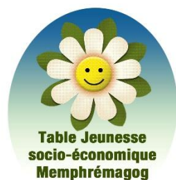
TABLE JEUNESSE SOCIO-ÉCONOMIQUE MEMPHRÉMAGOG